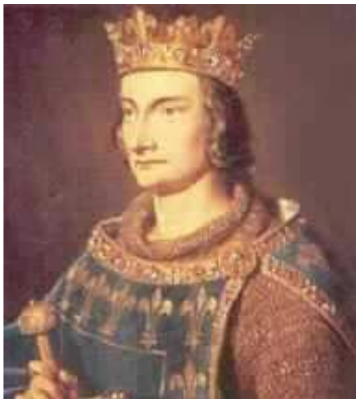
Fig. 6 - Filippo detto "il Bello" Re di Francia

Durante l'annuale capitolo generale dell'Ordine che si tiene nei giorni della festa dei Santi Apostoli (29 giugno) viene deciso di richiedere formalmente di aprire un'inchiesta super statu Templi . La richiesta viene fatta all'unica autorità terrena espressamente autorizzata a giudicare un pezzo della stessa Chiesa di Roma, il Romano Pontefice. Diciamo meglio, la sola persona del Romano Pontefice.