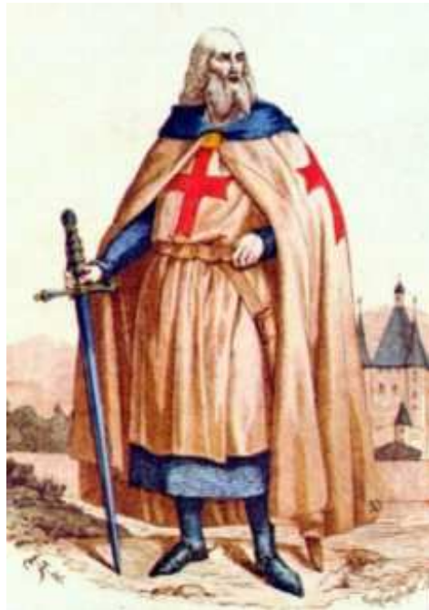
Fig. 4 - Fra' Jacques de Molay, ultimo Gran Maestro dell'Ordine del Tempio

I progetti di riforma che prevedono l'unificazione del Tempio e dell'Ospedale non trovano impreparati i vertici dell'Ordine giovanniti. Infatti, al contrario della ferma risposta negativa del gran maestro templare de Molay, il gran maestro ospitaliero Folco de Villaret 34 ha diplomaticamente evitato di dare una risposta ufficiale a Clemente V sul progetto di riunificazione degli Ordini e ha presentato un dettagliato memorandum sulla possibilità di una nuova crociata per la riconquista della Terra Santa 35 .