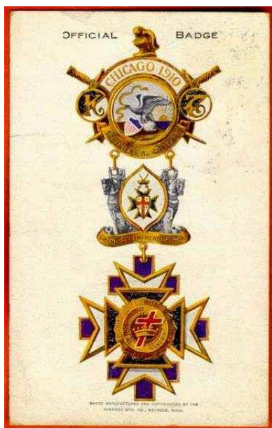
Fig. 8 - Insegne di un gruppo neo-templare di ispirazione massonica operante negli Stati Uniti d'America 1910 circa

febbraio 1304 da De Molay al Commendatore dell'Ordine a Gerusalemme Marc de Larmeny 50 ) sia attraverso tradizioni massoniche 51 (e il buco di quattro secoli?) e neotemplaristiche (con un florilegio e una fantasia di nomi e titoli 52 ).