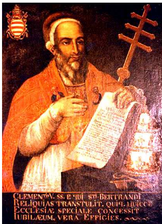
Fig. 7 - Papa Clemente V

subordinati, gli inquisitori di Tolosa e di Carcassonne, per annunciare l'arresto di alcuni membri dell'ordine templare per veementi sospetti di eresia. Lo stesso giorno Filippo nomina proprio guardasigilli Guglielmo di Nogaret 40 , il capo degli avvocati del Consiglio di Francia, il quale come primo atto firma l'ordine di arresto di tutti i templari in Francia.