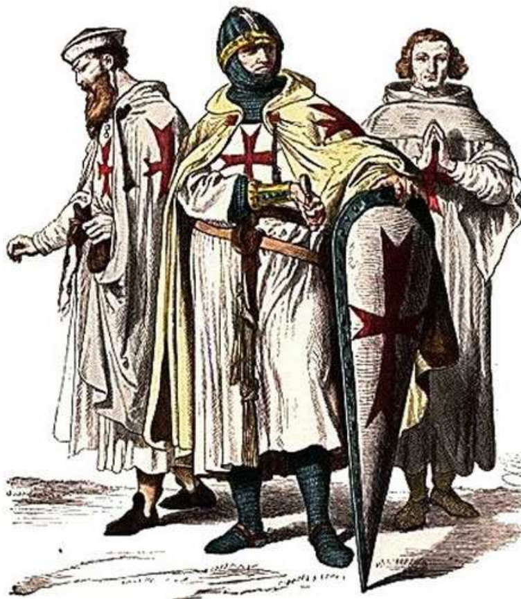
Fig. 3 - Abiti dei monaci Templari

L'inizio della fine dei regni latini d'Oltremare può essere riportato al 4 luglio 1187. Ai Corni di Hattin (altre letture indicano il toponimo come Hittin), presso Tiberiade nel centro del Regno di Gerusalemme, i cristiani subiscono la più grande disfatta militare da parte del condottiero musulmano Saladino, giovane figlio di un capo curdo al servizio del sultano turco Nur ad Din.