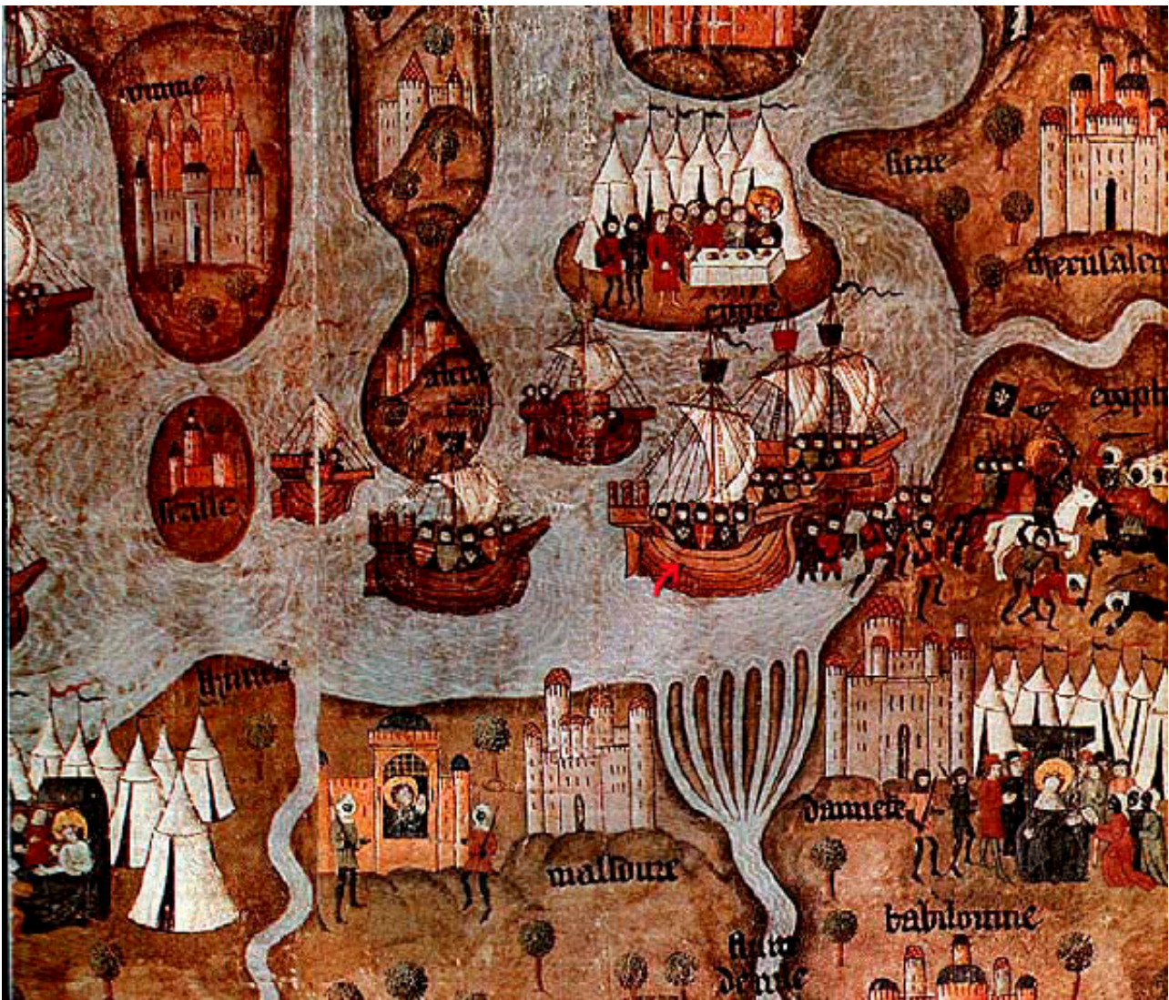
Fig. 1 - I Crociati in Terra Santa

I primi crociati arrivano sul Monte della Gioia (Montjoie) dopo tre anni di marcia, il 7 giugno 1099. Da lì godono finalmente della visione delle Città Santa, delle sue mura e dei suoi palazzi. Passato l'incanto, pongono subito sotto assedio la città, affiancando alle mura le macchine d'assedio da nord e da sud.