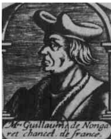
Fig. 5 - Guglielmo di Nogaret

patrimonio non è tassabile in quanto antichi privilegi riservavano le risorse degli ordini militari alle necessità (in primo luogo militari e assistenziali) della Terra Santa. Il re vuole fermamente porre quel patrimonio sotto il controllo della Corona di Francia e l'unificazione del Tempio e dell'Ospedale così come discusso durante il Concilio di Lione nel 1274, con a capo dell'ordine riunificato egli stesso, mentre sul trono gli sarebbe succeduto uno dei suoi figli.