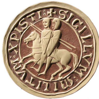
Fig. 2 - Sigillo dei Templari

fratres Templi o Templarii . Nel 1127 Ugo di Payns, come inviato di Baldovino II, ritorna in Europa in cerca di rinforzi militari per la difesa della Terra Santa. Nella regione francese dello Champagne, a Troyes, partecipa al concilio che istituzionalizza la confraternita e il 13 gennaio 1129 viene approvata la Regola dei Poveri Cavalieri di Cristo 19 in settantadue articoli 20 . Principale artefice ed ispiratore del contenuto della Regola è Bernardo abate di Chiaravalle, la maggiore autorità vivente della Chiesa Latina. Prima del Concilio di Troyes, Bernardo scrive il De laude novae militiae per difendere e giustificare teologicamente l'impegno dei Templari 21 .